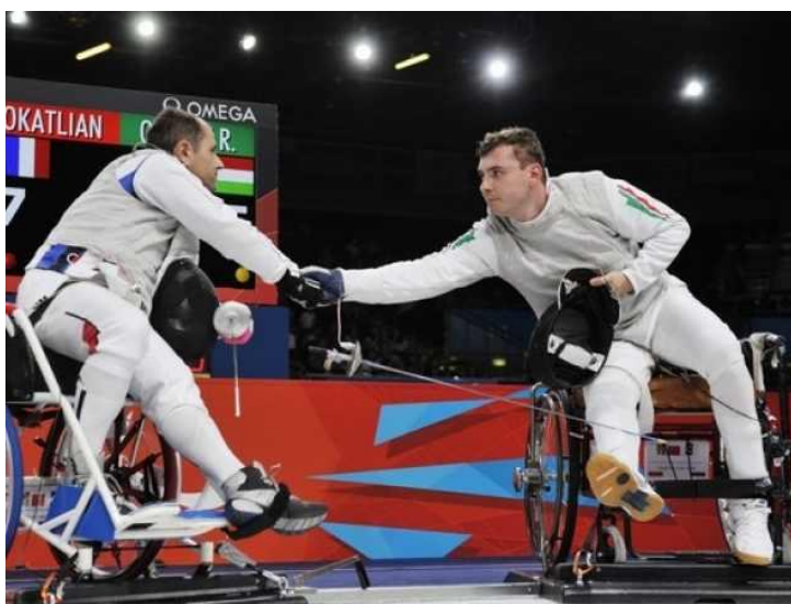
10. kép. Az asszó után

A Magyar Vívó Szövetség a sportágfejlesztési keretéből új sporteszközökkel támogatja a kerekesszékes-vívókat. Ebből az összegből új pástokat, székeket, találatjelzőket és egyéb felszereléseket kaptak budapesti és vidéki vívóegyesületek. Ennek következtében az egyik legsikeresebb paralimpiai sportág körülményei jelentősen javulnak.