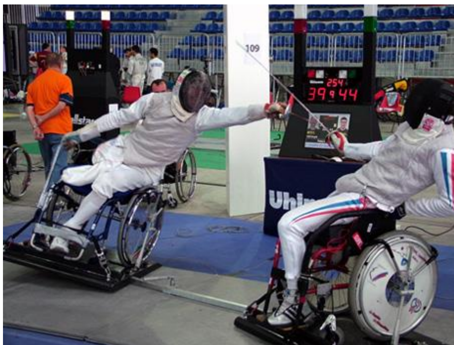
8. kép. A kerekesszékes vívók

Kerekesszékes-vívás „A” kategória: felállni képesek sérültségi kategóriája