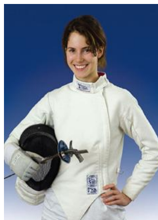
4. és 5. képek. A sportiskolás és a versenyző