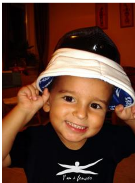
3. kép. A jövő bajnoka