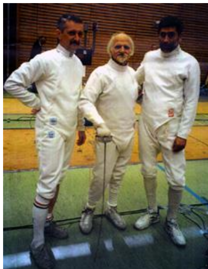
6. kép. Az amatőrök