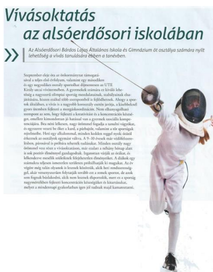
7. kép. Az iskolai program (forrás: www.utevivas.hu)