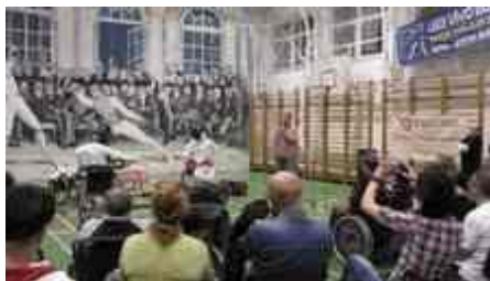
11. kép. A versenyen

A Baptista Szeretetszolgálat Regionális Szociális Központ kerekesszékes-vívás bemutató létrejöttét segítette a debreceni Békéssy Béla vívócentrumban a DHSE-PMD Vívóklub nyílt napján. Krajnyák Zsuzsa párbajtőröző világbajnok, tizennyolcszoros Európa-bajnok, a londoni Paralimpia kétszeres ezüst, egyszeres bronzérmese, illetve Dani Gyöngyi kilencszeres Európa-bajnok töröző, London kétszeres ezüstérmese bemutatót tartottak, majd a hallgatóság kipróbálhatta, milyen a versenyzők ellen a vívás.