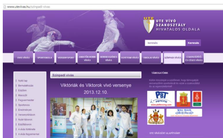
9. kép. Az UTE Vívószakosztály honlapja

szakosztályok a szabadidősport és az amatőr sportolók felé fordultak, akkor erre a hirdetési formára nem is volt szükség. Egyrészt az emberek maguk keresték a sportolási lehetőségeket, másrészt egy-egy kedvelt, népszerű program és műsorújságban ingyenesen lehetett sportszolgáltatásokat hirdetni. A plakátnak nem volt értelme, az internet még nem volt elterjedt, így az ingyenes hirdetéseknek megvolt a maguk hatása. Az iskolákban - amennyiben az iskola vezetése hozzájárul – lehet szórólapokon tájékoztatást nyújtani. Az UTE vívószakosztálya él is ezzel a lehetőséggel a VII. kerületben, ki is alakítottak különböző szintű együttműködésekkel iskolákkal. A közösségi médiában (elsősorban Facebookon) és az internetes jelenlét (saját honlap) kifejezetten fontos és hatásos eszköz azok számára, akiket eleve érdekel a vívás, és keresik a lehetőséget, milyen feltételek mellett tudnának sportolni (9. és 10. képek). Az érdeklődők néhány kattintással begyűjthetik a számukra megfelelő információkat, és ennek alapján már tudnak dönteni.