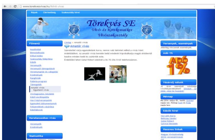
10. kép. A Törekvés SE honlapja