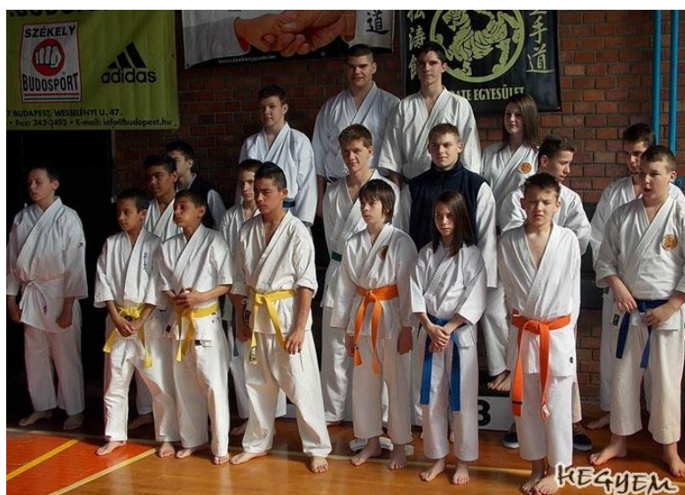
6. kép. A csapat