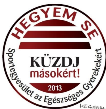
1. ábra. A 2013-as logó

2014 elején újabb lényeges változás történt a HEGYEM életében: megalakult ugyanis a HEGYEM SE, az a sportegyesület, amely kizárólag a sportolásra, sportoltatásra, versenyeztetésre koncentrálhat. A jövőben tehát a karitatív-szociális, illetve a sporttevékenység elkülönül majd, mind szervezetileg, mind a támogatási formákat tekintve. Az újdonsült sportegyesület nagyobb hangsúlyt helyezhet az eredményes versenyeztetésre, és ez annak ellenére is fontos lépés, hogy a támogatott fiatalok már korábban is szebbnél-szebb eredményeket produkáltak hazai és nemzetközi viszonylatban is.