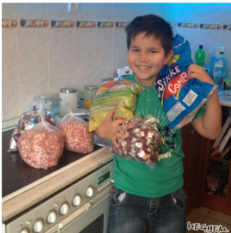
5. kép. A kis bajnok