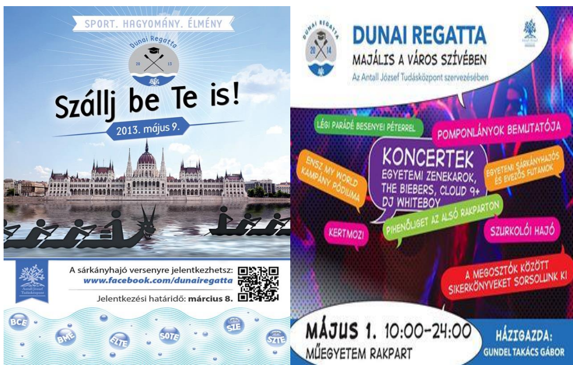
5-6. kép. A 2013-as és az idei esemény plakátja

A rendezvénynek külön Facebook oldala van, melyre lényegében a kommunikáció épül. A célcsoportot tekintve az egyik legjobban kiaknázható terület a közösségi felület, hiszen az érintettek legnagyobb részét ezáltal lehet elérni. A Facebook közönségbevonzó hatása nagyon erős, ugyanakkor sportnapokra és bulikra is elmennek a szervezők az esemény promotálása végett. A program önálló eseményként is fent van a Facebook-on, a tanulmány készültkor (2014 áprilisa) az esemény több mint 10.000 like-al rendelkezett és 3500 ember osztotta meg valamilyen formában az ismerőseivel. Ezekon a felületeken a Regatta profilja és megjelenése arculatában jól tervezett és koherens egységet alkot.