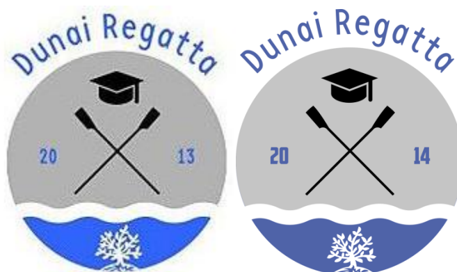
1-2. kép. A regatta emblémái

A Dunai Regatta fő céljai két területre oszthatók. Egyrészt erőteljesen megjelenik az evezőssport népszerűsítése, másrészt szintén hangsúlyos az egyetemi hallgatói élet fejlesztése.