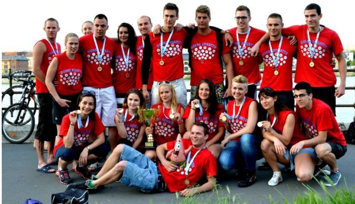
7. kép. A tavalyi győztes, a Semmelweis Egyetem csapata

2014-ben összesen 11 csapat versenyez mind a sárkányhajó, mind a nyolcasok versenyében. A nyolcasokat profi evezősök alkotják, míg a sárkányhajósok általában lelkes amatőrök. A rendezvény több helyszínen zajlik, így a pontos résztvevői létszámot nehéz meghatározni. A 2013-as első versenyen nagyjából 5000-6000 néző volt a különböző programokon. A 2014-es évben a látványos programoknak köszönhetően várhatóan 15-20 ezer látogató lesz a versenyen.