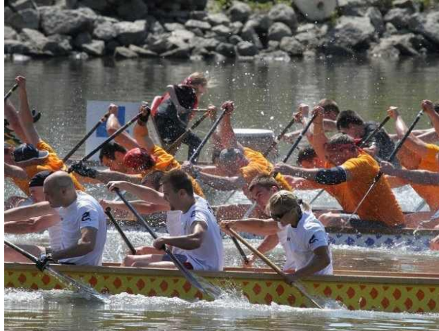
8. kép. A népszerű sárkányhajó verseny

A Fornetti is a Dunai Regatta partnere, ez által 5-6 millió tasakon vannak jelen a hirdetések, és ebben a formában jóval a verseny előtt tudják már promotálni a programokat. Már-már hagyományteremtő lesz a rendezvény, a sárkányhajósoknál már most harc folyik, hogy ki ülhet be a hajóba, mely örvendetes tény, hiszen az első évben ez másként volt.