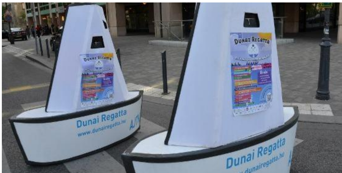
7. kép. Gerillareklám

Az információközlés mellett a kétirányúság is hangsúlyosan jellemzi a kommunikációt. A kérdések legnagyobb része a Facebook-on és e-mailben érkezik, emiatt külön e-mail címe van a programnak, amire folyamatosan lehet írni. Ezekre az e-mailekre minden esetben válaszol a szervezők által kijelölt egyetlen fő. Emellett a személyes visszajelzések és az élő kommunikáció is jelen van, amiből a verseny maga is sokat profitál. A bejövő ötleteket, javaslatokat a korábbi verseny kapcsán összegyűjtötték a szervezők és idén nagyon sokat megvalósítottak belőlük. Ilyenek a mostani gerillareklámok is (4. kép).