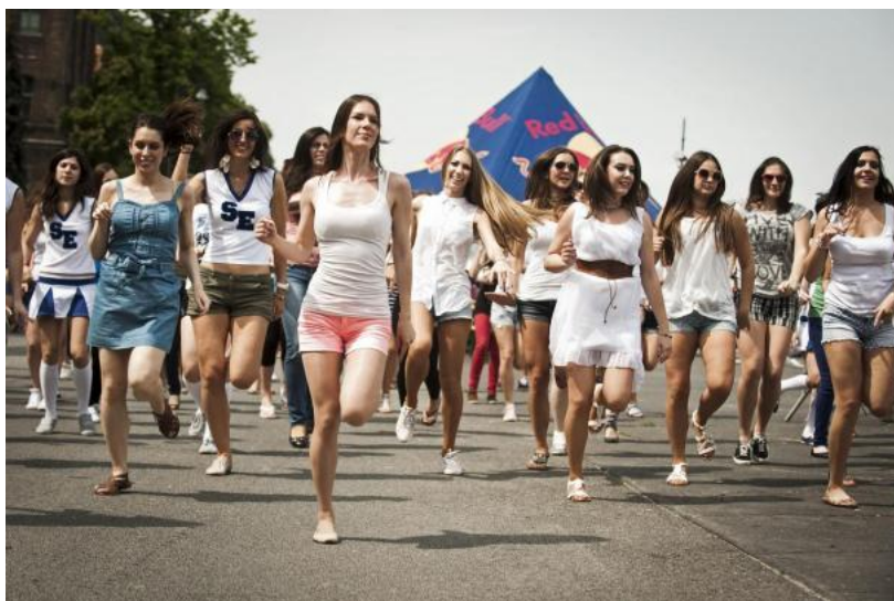
3. kép. A jelmezes futóverseny

A hivatalos megnyitón az Európai Unió és a Visegrádi országok (V4) képviselői is részt vesznek. Utána kezdődnek a futamok, lesznek interjúk, díjátadás és az éjfélig tartó koncertek.